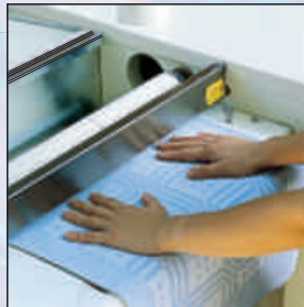
Fingerschutz - Salvamani Safety device for hands Sécurité protège doigts