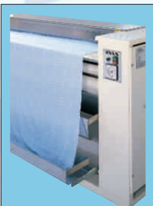
Eingabetrog oberhalb des Bodens Vaschetta di intrmissione in basso Basin below - Récipient ci-dessous