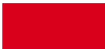
9. КРАСНЫЙ (red)