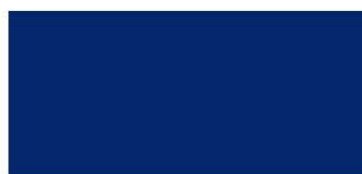
11. МОРСКОЙ (marine navy)