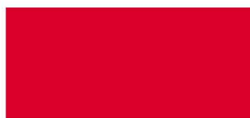
16. КРАСНАЯ ВИШНЯ (carmine)