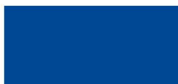
14. СИНИЙ (blue)