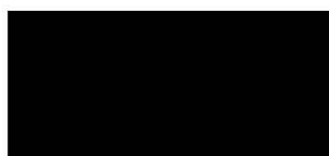
15. ЧЕРНЫЙ (black)