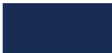
18. УЛЬТРАМАРИН (ultramarine)