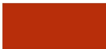
8. КИРПИЧНЫЙ (red brick)