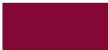
2. БОРДОВО-МАЛИНОВЫЙ (burgundy maroon)