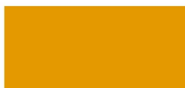
13. ОХРА (ohra)