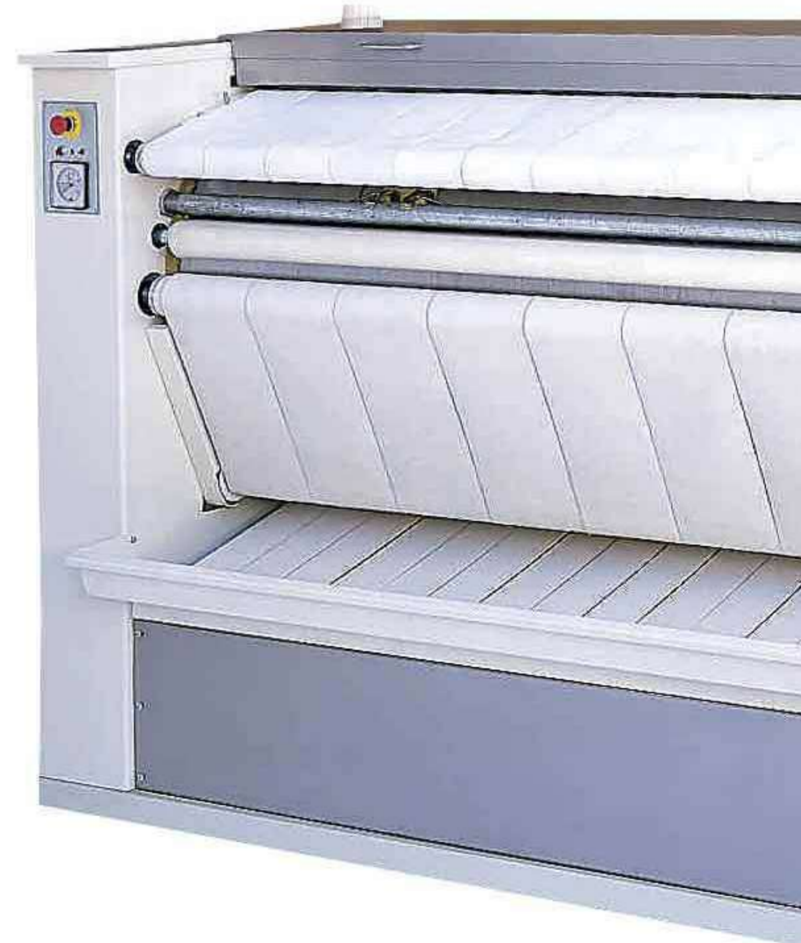
Серии MVR/GVR: модели класса люкс с возможностью выдачи белья с задней стороны

Адаптация оборудования к стандартным размерам коммерческого белья позволяет использовать вал каландра по всей его длине. Для высвобождения дополнительного пространства все наши «пристенные» машины могут быть установлены посты вплотную к стене!