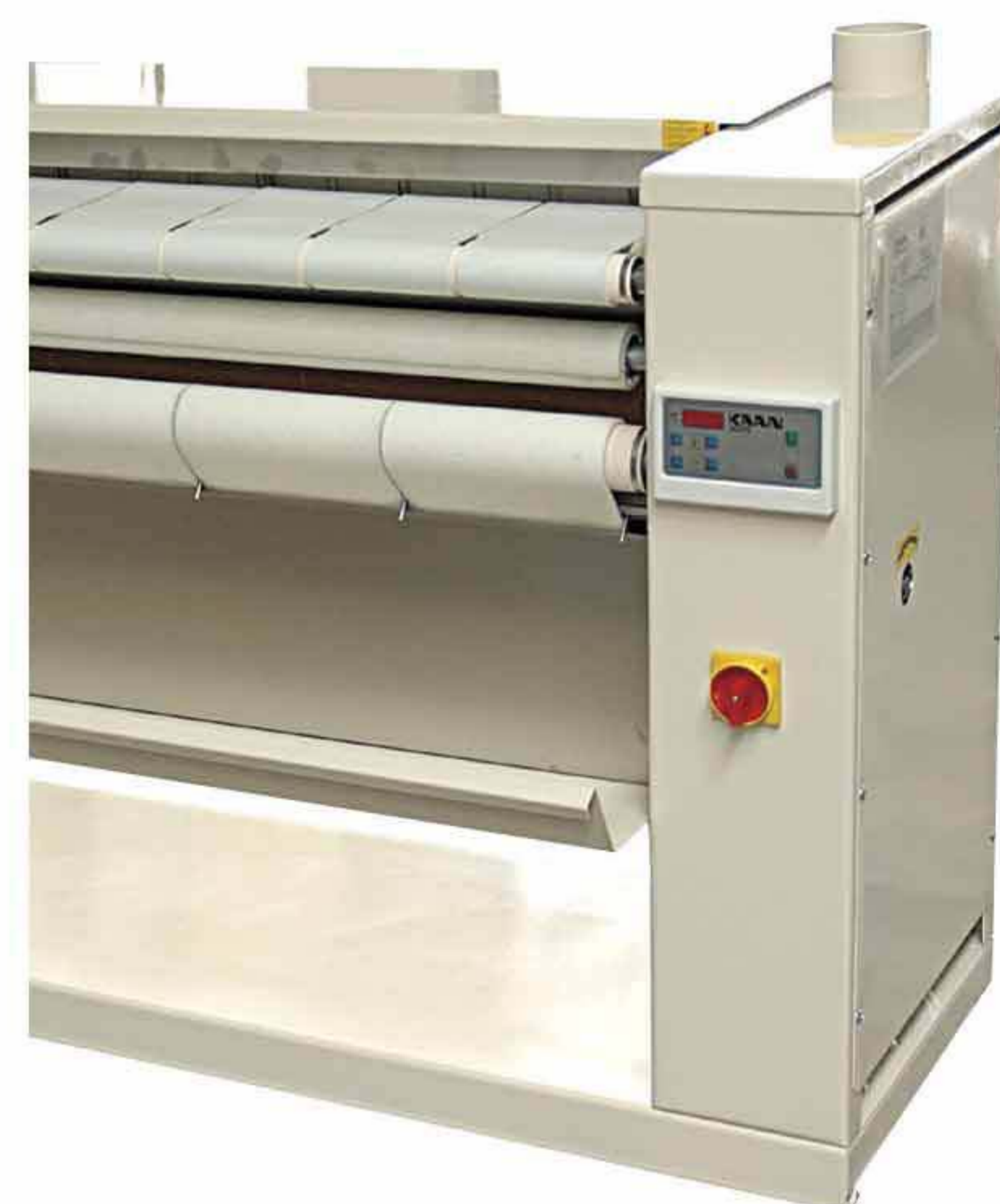
Серия Junior: компактные и эффективные модели

+ Предлагаемая система является оптимальным решением для любой современной прачечной, поскольку позволяет отказаться от использования центрифуги для белья и, в большинстве случаев, барабанной сушильной машины. Снижение расходов на содержание помещений и эксплуатацию оборудования, сокращение затрат, связанных со временем, энергией и рабочей силой, также благоприятно сказываются на общих расходах предприятия и гарантируют быструю окупаемость финансовых вложений предприятия.