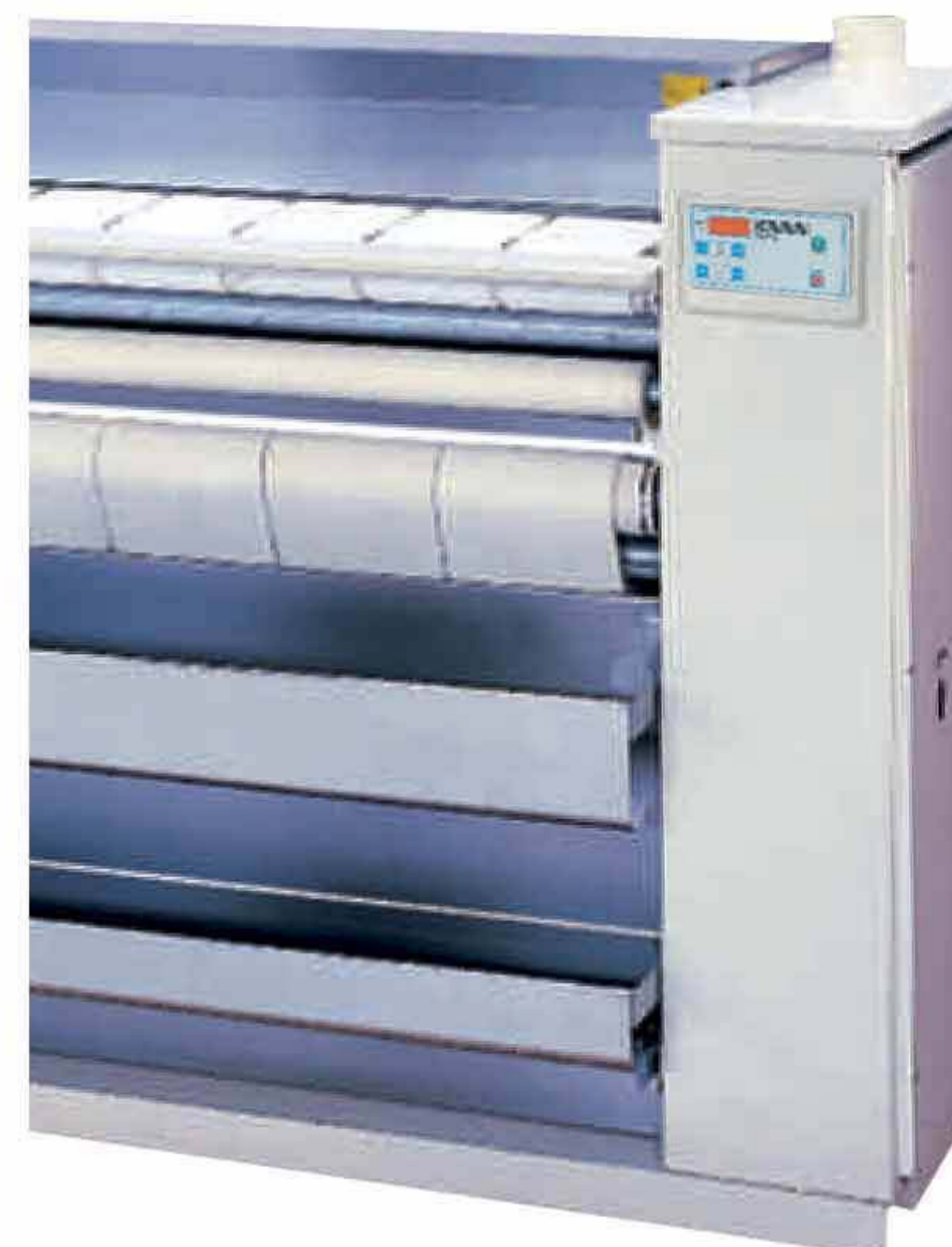
Серии K/M/G: модели, полностью оснащенные всем необходимым для эффективной и безопасной работы.