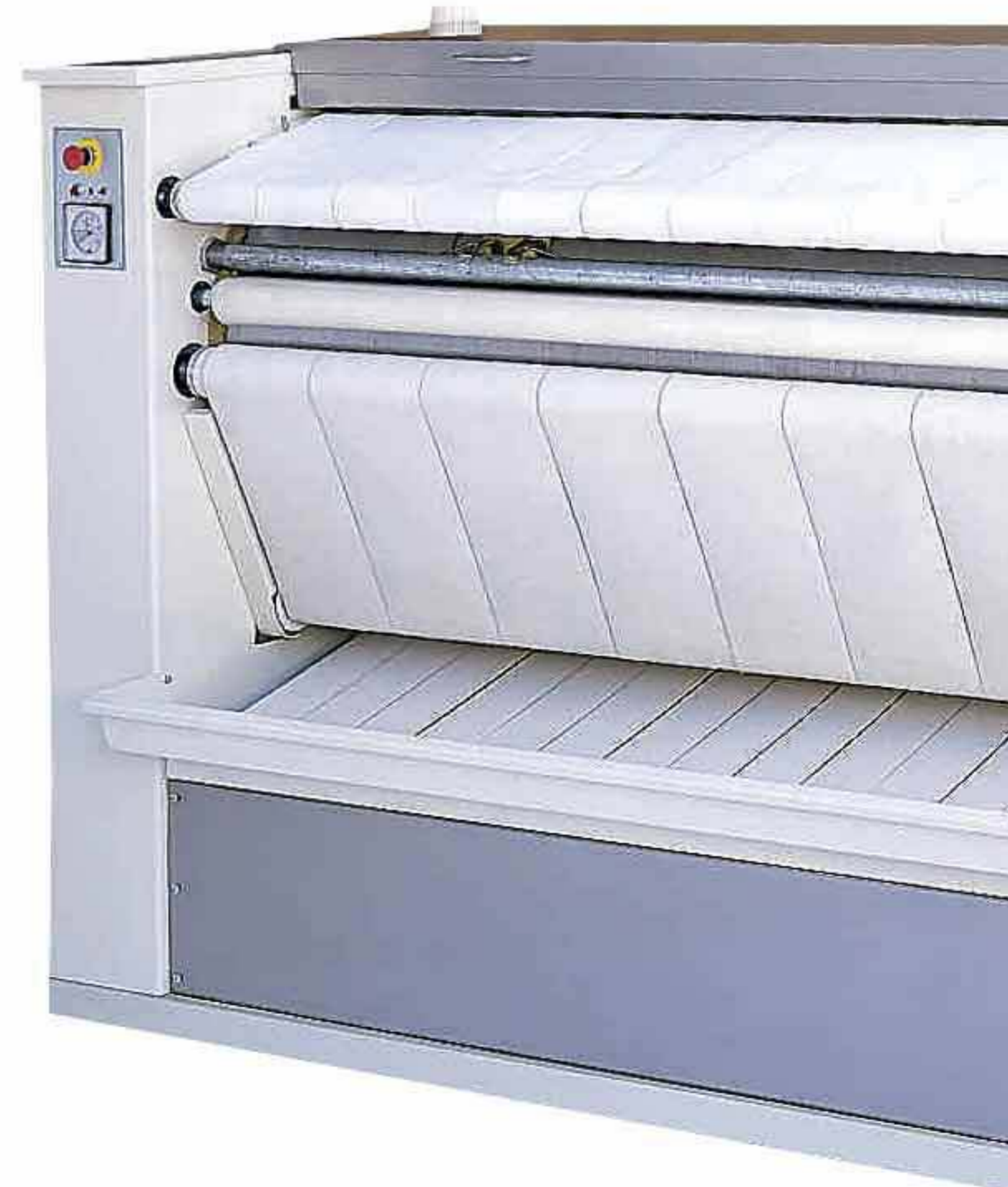
Серии MVR/GVR: модели класса люкс с возможностью выдачи белья с задней стороны

Адаптация оборудования к стандартным размерам коммерческого белья позволяет использовать вал каландра по всей его длине. Для высвобождения дополнительного пространства все наши «пристенные» машины могут быть установлены посты вплотную к стене!